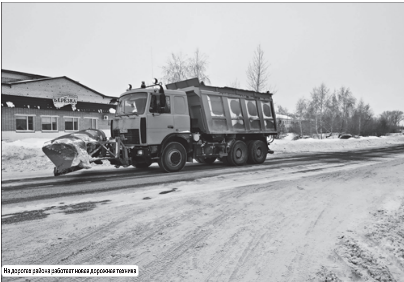
На дорогах района работает новая дорожная техника

8 января на оперативном совещании в режиме видеоконференции губернатор Иван Белозерцев подвёл итоги праздничных дней и новогодних каникул.